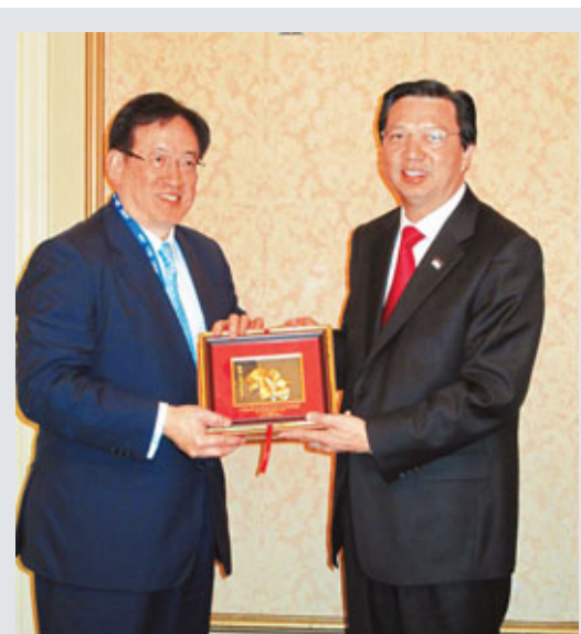
■周一嶽出席亞太經合組織高層會議前，與馬來西亞衛生部長廖中萊舉行雙邊會議。會後，周一嶽向廖中萊部長致送紀念品。

達成協議。其中，為使香港發展為區域教育樞紐，雙方同意促進教育官員和專家之間進行高層政策對話，就學歷認可、課程改革和資歷架構發展等共同關注議題交換意見。同時，香港與比利時經已同意成立工作小組，探討兩地科研合作。 另外，曾蔭權昨返港後，被問及下屆特首選舉情況。他重申不適宜評論任何關於特首選舉的事。