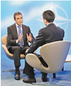
■北約秘書長拉斯穆森(左)接受新華社記者專訪。新華社

文章對一些方面給予了重點觀察，報告在評估中國的各種軍事和安全發展時，國防部突出了幾個重要的發展。「惡化」的台海軍事平衡或許是重複最多的內容：報告稱，儘管兩岸關係有所改善，台灣軍隊未能趕上解放軍穩步推進的現代化。加上美國售台武器受到限制(報告中沒有提到這點)，台灣正在落後，難以追趕大陸軍事發展的步伐。當然，這也會對美國產生影響。由於解放軍正在尋求「震懾、遲滯或阻止美國或多國聯合對台海衝突進行干預」。