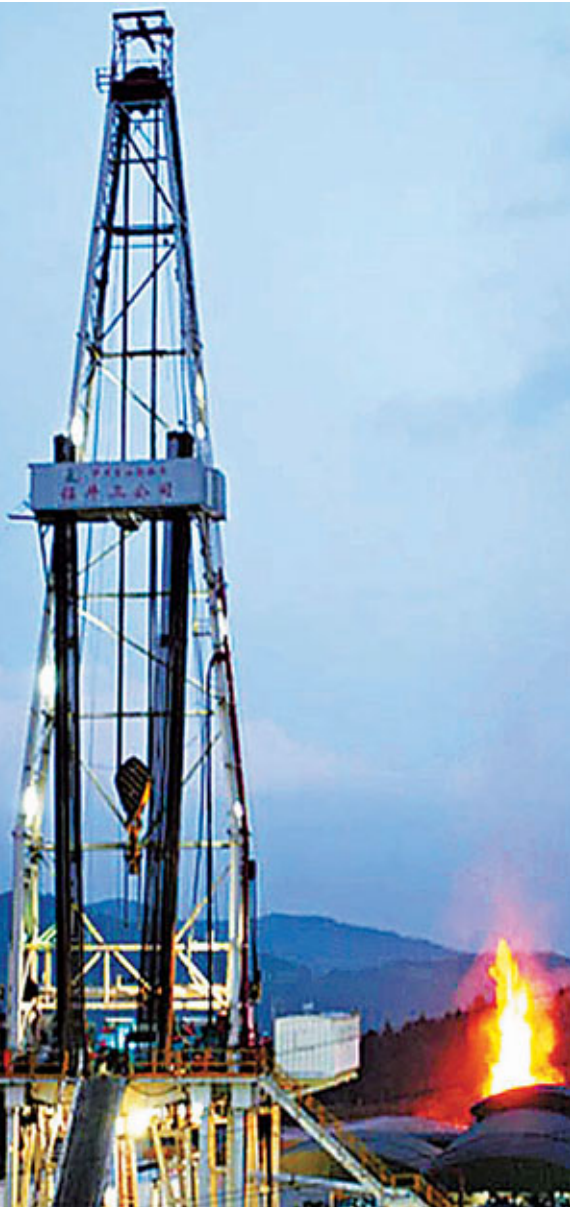
■元壩氣田部分探井已經試獲日產天然氣50萬立方米至100萬立方米。網上圖片

中國石油大學工商管理學院副院長董秀成早前表示，從中國的能源結構看，大力發展天然氣是必然之舉。董秀成表示，石油供應能力有限，長期受制於人，煤炭供應雖相對充足，但在降低單位GDP能耗和控制污染的大環境下，利用的增長前景也有限。風能等新能源目前只能作為補充，天然氣將成為中國能源供應增長的必然選擇。