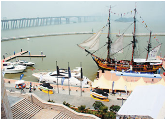
■南沙新區計劃打造嶺南水鄉之都。圖為坐落在南沙港的遊艇會。資料圖片

香港文匯報訊（記者 沙飛 廣州報道）近日，據廣州市南沙新區開發建設現場會獲悉，南沙新區首次透露了《南沙新區總體概念規劃》（以下簡稱《規劃》）。這個「將來還可以乘船出入」的新區，欲在珠三角打造世界一流的「精品灣區」，但不「克隆」香港、日本或者其他地區的建築風格，也不盜版其他城市的建築模式。可以確定的是，該《規劃》方案一旦通過，也將是南沙「擴容」之時。