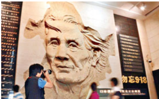
■9月18日，是「九·一八」事變80周年紀念日。連日來，各地民眾紛紛來到東北抗日戰爭紀念館，緬懷先烈。

由20名當年日本侵華老兵及青年學生、學者組成的日本口述歷史友好訪問團，當天在偽滿皇宮博物院通過口述歷史的方式，回顧那場戰爭給中日兩國人民帶來的痛苦與災難。