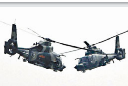
兩架武直9低空對衝，驚險刺激。中新社

香港文匯報訊 據中新社報道，本月15日，在天津舉行的首屆中國天津國際直升機博覽會開幕式上，中國人民解放軍陸航直升機飛行表演隊首次亮相，武直9和直11兩種機型分別進行了多機、雙機、單機飛行表演，精彩紛呈，展示了國產直升機優越性能和飛行員精湛的飛行技能。