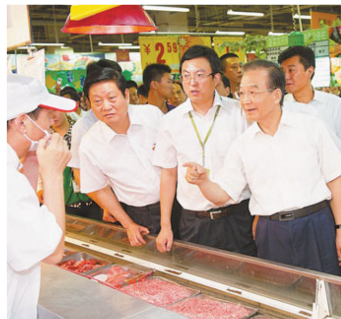
國務院總理溫家寶此前在陝西考察市場。

溫家寶回應指，這個建議很重要。政府要抓緊研究牛羊肉的整體發展規劃，包括扶持政策。目前，政府已在牧區採取了一系列的政策，但是對農區的牛羊肉生產，還沒有太具體的措施。溫家寶強調，這件事情如果再不抓，可能又會出現一個牛羊肉的困難局面，一旦牽扯到奶業將更為複雜。