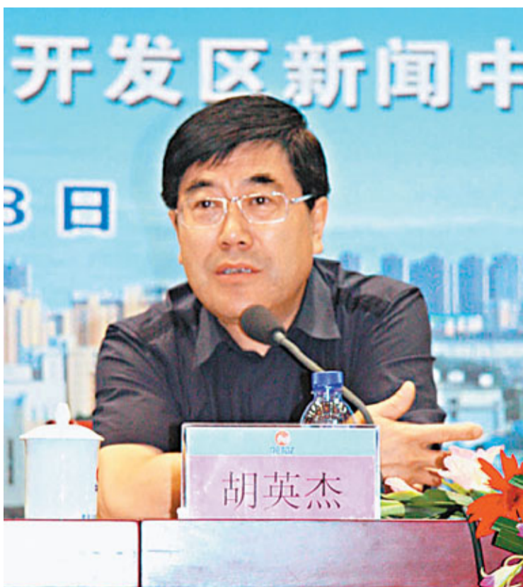
胡英傑稱，今後秦皇島開發區將大力發展數據產業、生物及新醫藥、新能源與節能環保等戰略性新興產業。