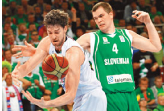
加素(左)遭對手從後侵犯。

自從20年前宣布獨立後，只得200多萬人口的歐洲小國馬其頓，在國際籃球壇一直未有突出成績，最大成就是2年前曾躋身歐錦賽決賽圈賽事，不過今年這支最大黑馬繼續製造驚喜，歷史性殺入4強。而屬於歐洲籃球強國的立陶宛，在主場意外落敗後，將與另一敗軍斯洛文尼亞爭奪前6名，保持晉級倫敦奧運的機會。根據賽制，挺進決賽的2支球隊將直接獲得奧運入場券，而第3名至第6名的球隊則要再進行附加賽爭奪奧運資格。