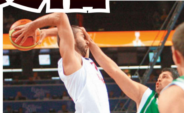
拿華路(左)欲傳球時吃了一巴掌。