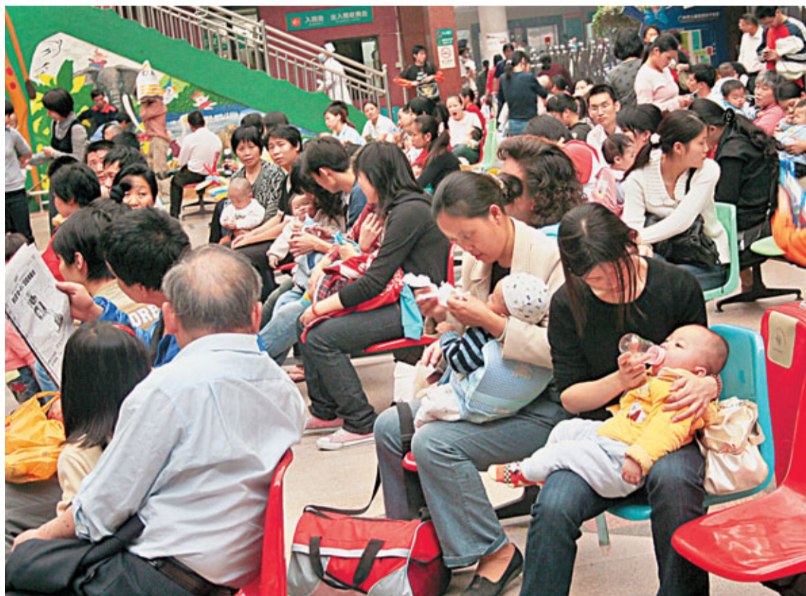
廣東出生人口性別比例失衡嚴重,男女嬰兒出生比已經達到119:100。 資料圖片

據悉,廣東已將2010年「六普」出生人口性別比高於125的市、縣(市、區)列為「省出生人口性別比重點管理地區」,並對其進行重點指導、督查和考核。對於出生人口性別比高於107的市、縣(市、區),廣東省制定出每年下降超出107部分10%的目標。未完成目標地區黨政領導、相關責任部門將無法通過考核,新聞媒體將公開違法行為。