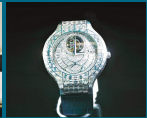
■伯爵Piaget Polo陀飛輪珠寶腕錶。