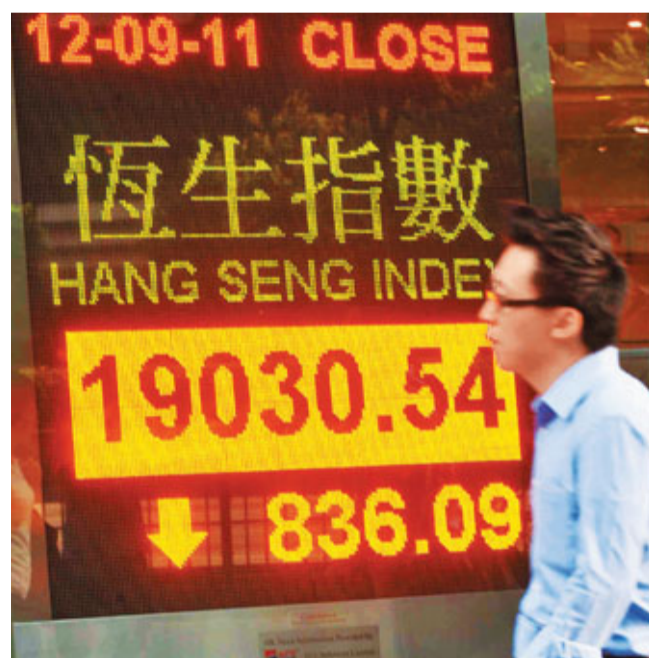
■港股周一大跌836點，險守萬九關，今復市走勢惹關注。