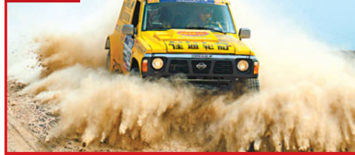
■環塔拉力賽接近尾聲，各參賽車手駕駛著戰車艱難地在沙漠中前行，而艱苦的比赛也令多名摩托車手退賽。