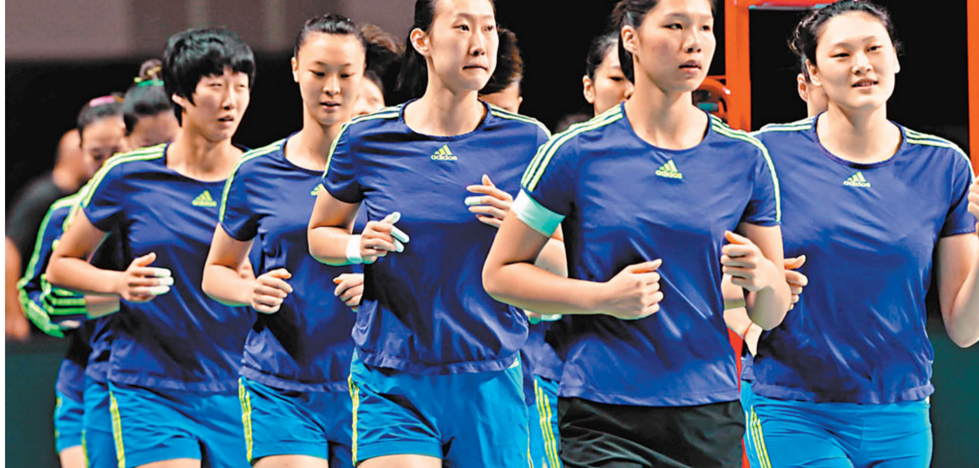
■中國女排積極備戰亞錦賽。