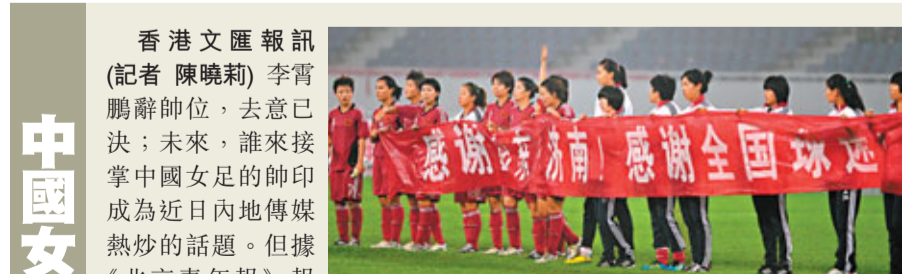
■中國女足不敵日本後打出橫額感謝球迷。新華社