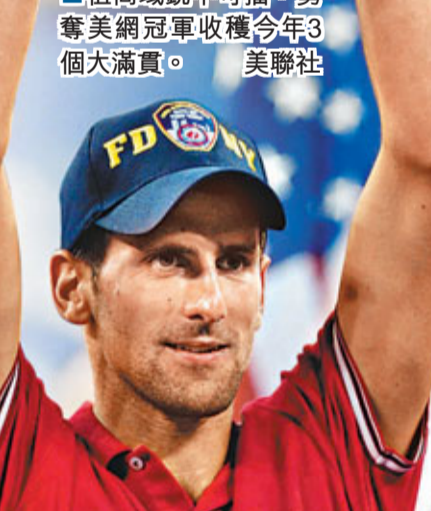
祖高域銳不可擋，勇奪美網冠軍收穫今年3個大滿貫。