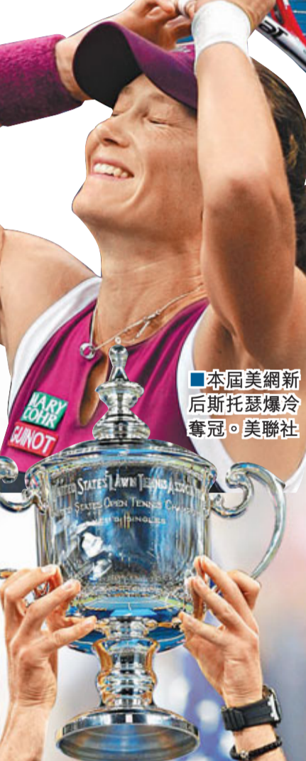
本屆美網新后斯托瑟爆冷奪冠。