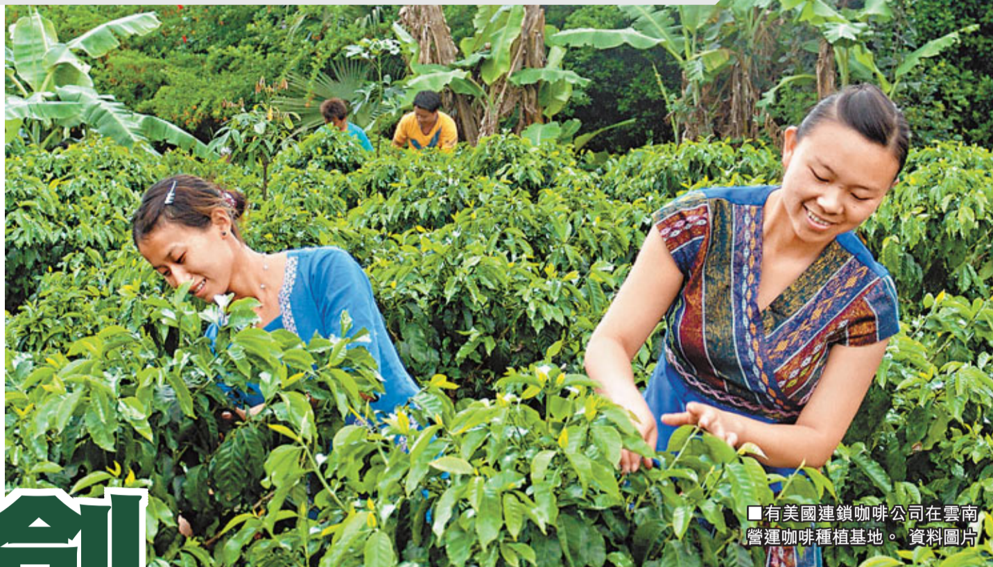
■有美國連鎖咖啡公司在雲南營運咖啡種植基地。資料圖片