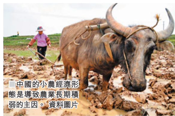
■中國的小農經濟形態是導致農業長期積弱的主因。資料圖片

佐證「市場創造財富」這一經濟學名詞的論著汗牛充棟，而這句話對農業和農村來說同樣適用。中國農村、農民和農業積貧積弱的原因之一，是農村長期以來受自給自足形態的小農經濟的影響，農產品商品化率極低，階層化的農戶重積累而輕消費，導致資財之源近於枯竭而無生機。而且在建國後，尤其是土地改革以來，農村被牽涉入數次政治運動中，生產完全受政治力量的支配，市場因素完全被排除在田野外。因此，當「公司+農戶」這種有着農業市場化意義的模式從上世紀90年代逐漸流行起來的時候，農村的經濟面貌得到很大改善。