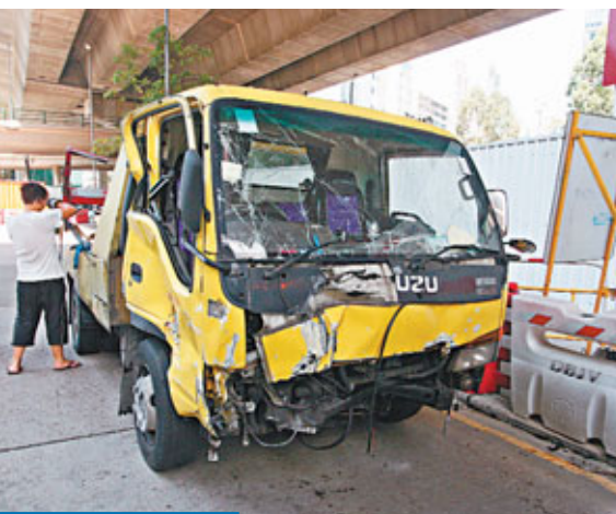
拖車掃欄翻側 香港文匯報訊(記者 杜法祖)長沙灣昨午12時47分發生拖車翻側意外，一輛拖車沿荔枝角道向葵涌方向行駛，途至近月輪街交界時，28歲姓劉司機稱因閃避一輛突然切線車輛而失控，撞向路旁及掃毀鐵欄後翻側，司機頭部及右臂受傷。警方及救護員接報到場將傷者送院救治，劉事後通過警方酒精呼氣測試。警方正調查肇事原因。

據其子表示，母親在昨下午改服中藥後，在下午2時至6時出現神情呆滯，家人不以為意。及至晚上7時許，母突身抽搐，繼而暈倒不省人事，馬上召喚救護車陪同母親入院救治。