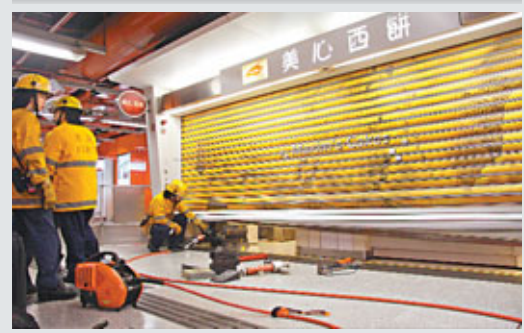
■消防員利用工具撬開餅店電捲開救出店員。

香港文匯報訊(記者 杜法祖)荔枝角港鐵站一間連鎖西餅店昨晨發生罕見意外，2名女店員早上返店打點妥當準備開門營業之際，發現店門電捲開突然故障無法開啟被困店內，2人向港鐵站職員求助仍無法將門打開，唯有報警由消防員到場利用工具將電捲頂起，將2名女店員救出，2人僅受虛驚毋須送院。