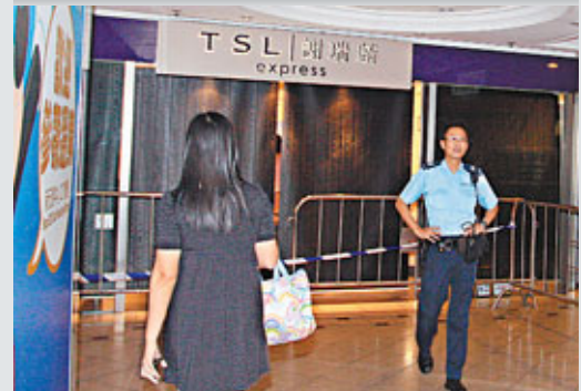
■警員在新元朗中心被撬竊首飾店外調查。

香港文匯報訊(記者 杜法祖)元朗新元朗中心一間首飾店，昨凌晨遭匪徒撬開關門潛入撬竊，損失飾物約值10萬元，3名竊匪得手後乘坐私家車逃去。元朗警區刑事調查隊第10隊已接手調查，追緝竊匪歸案。