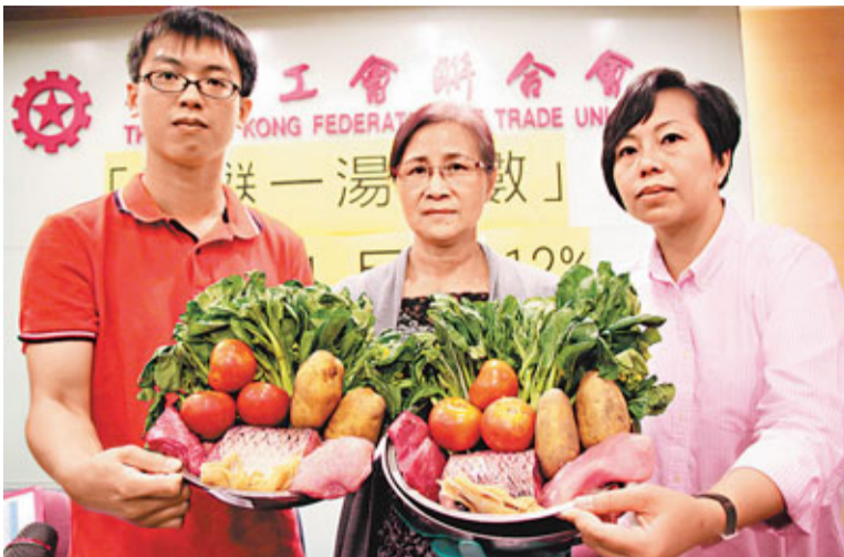
工聯會「兩餸一湯」調查發現,1月份以78.4元可購得3斤14兩的分量(左),9月時以同樣價錢只能購得3斤1兩的分量(右),少了約20%。