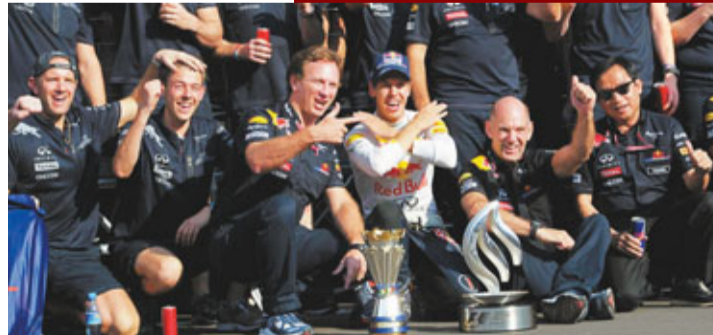
維泰爾(前中)只要在新加坡站報捷即告成功衛冕。

紅牛車隊的維泰爾11日在意大利站一級方程式(F1)大獎賽中，克服起跑不利的被動局面，以1小時20分46秒172輕鬆奪得今季的個人第8個冠軍，維泰爾只要在今個月稍後舉行的新加坡站賽勝出，就可以提早第2度贏得世界冠軍。維泰爾是役排頭位出賽，但很快便被法拉利的艾朗素超前，力守第2位，在第5圈成功超越艾朗素而再度領先，直至衝線，麥拿拿車隊的畢頓得亞軍，艾朗素得季軍。在積分榜上，維泰爾拋離第2位車手112分，而本季賽事還有6站結束。