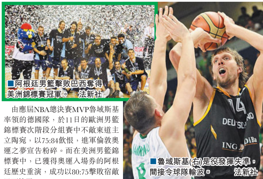
魯域斯基(右)是役發揮失準，間接令球隊輸波。

由應屆NBA總決賽MVP魯域斯基率領的德國隊，於11日的歐洲男籃錦標賽次階段分組賽中不敵東道主立陶宛，以75：84飲恨，進軍倫敦奧運之夢宣告粉碎。而在美洲男籃錦標賽中，已獲得奧運入場券的阿根廷歷史重演，成功以80：75擊敗宿敵巴西捧盃。