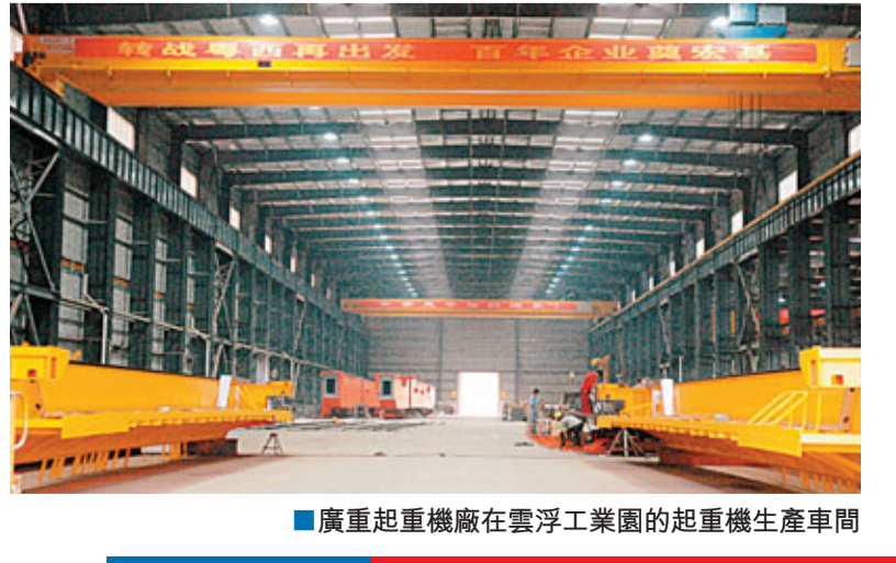
■廣重起重機械在雲浮工業園的起重機生產車間

園區坐落在德慶縣官圩鎮開發區，總規劃面積6500畝，到2010年底，園區共投入資金7億多元（政府及企業直接投資）。目前已有27家來自珠三角地區的產業轉移企業落戶園區，其中已建23家，在建3家。首期開發用地產業佈局為打火機（煙具）、傢具行業。2010年，園區企業實現工業總產值28.13億元，同比增长74.92%，佔德慶縣總產值的26.3%；實現稅收3084.6萬元，同比增长66.7%，佔全縣工業稅收的16.85%，已初現經濟效益和社會效益。其主導產業包括打火機（煙具）、傢具行業。