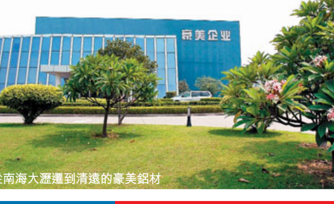
■從南海大瀝運到清遠的泰美經材

產業園所在地，產業集羣明顯，承接產業轉移空間廣闊。佛山禪城（陽東萬象）產業轉移工業園是陽東經濟開發區的一個重要功能片區。廣東陽東經濟開發區是經國家審批公告的省級開發區，區內先後建成「中國開平中心」、「中國開平中心」、「中國開平中心」、「中國開平中心」和亞洲最大的果凍生產基地，發展工業企業2000多家，逐步形成了以五金刀剪、食品、光電子、醫藥化工、機械製造等十大主導產業為主的工業集羣，是陽東縣的「工業航母」。