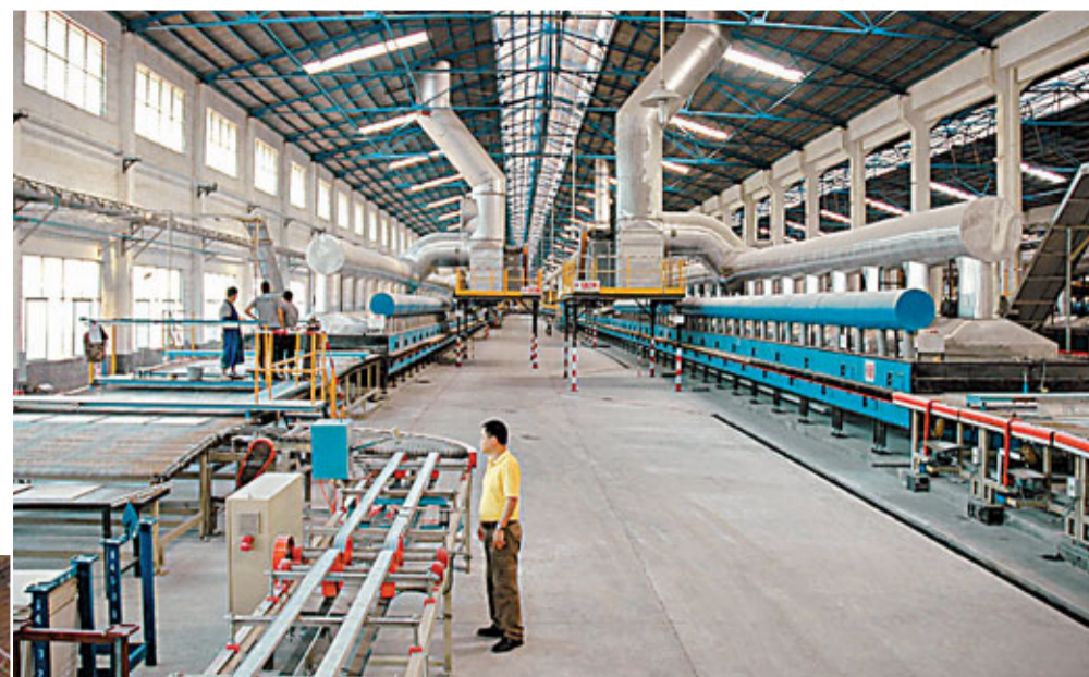
■由佛山轉移到清新的陶瓷企業，設備升級後的現代化陶瓷生產線，廠區及車間見不到灰塵。