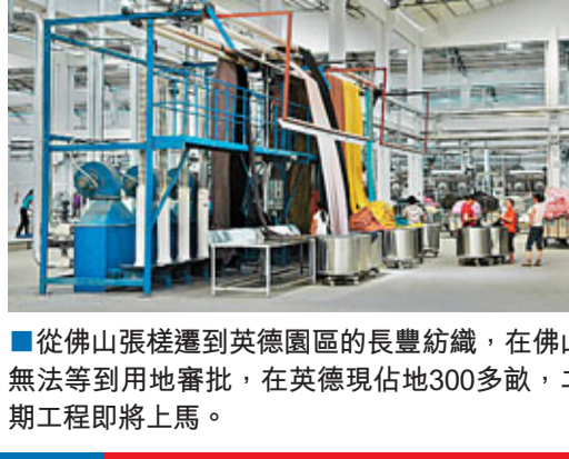
■從佛山張槎運到英德園區的長豐紡織，在佛山無法等到用地審批，在英德現佔地300多畝，二期工程即將上馬。

清遠華僑工業園總體規劃結合山體、河流和綠化等自然生態要素，形成「一心兩軸三帶八組團」，成為一個開放式、彈性的發展工業園新模範。着力打造成為一個產業集羣、主導產業突出、配套設施完善的宜工、宜商、宜居、宜業的現代生態產業新城。