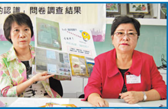
婦聯調查指有食品出現「1件產品,5個不同地區標籤」的情況,部分標籤更只有英語。小圖顯示標籤比2元硬幣更細。

歐陽寶珍建議,政府統一規管營養標籤的顯示方式,包括字體大小、顏色、位置及食用分量,並提供中、英文說明,又認為政府應在大型超級市場張貼海報,並與地區團體及學校合作,舉行公眾教育活動,以淺顯生動的手法,增加市民對有關制度的認識。