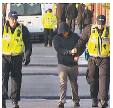
警方拘捕其中一名疑犯。

英國發生聳人聽聞的現代畜奴事件,警方接到線報,在中部貝德福德郡突擊搜查一個吉卜賽人聚居地點,救出24名「奴隸」。警方指該24人被逼迫充當無薪苦工,在惡劣不堪的環境居住,包括狗屋、運馬貨車等,恍如納粹集中營,部分人更滿身狗糞。