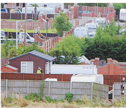
警方在萊頓巴澤德一處大宅搜證。