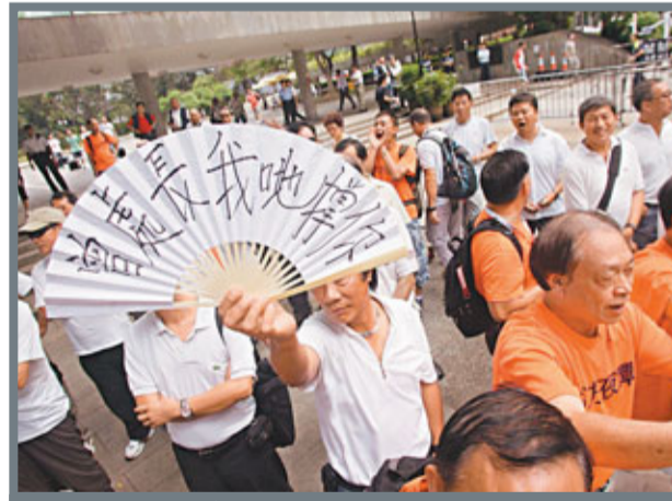
退休警務人員身穿白衣到場支持警務處長。

另外，特區政府發言人昨日發表聲明，就近日有示威者衝擊諮詢論壇的會場，推撞場地職員致受傷，並破壞會場設施的暴力行徑予以譴責。發言人強調，特區政府一向非常尊重市民的言論自由，而香港社會亦一向認同要以理性、和平的方式表達訴求，並再次提醒示威者，當自由表達訴求時，必須守法和不影響社會秩序，共同維護香港社會認同和平、理性的價值觀。