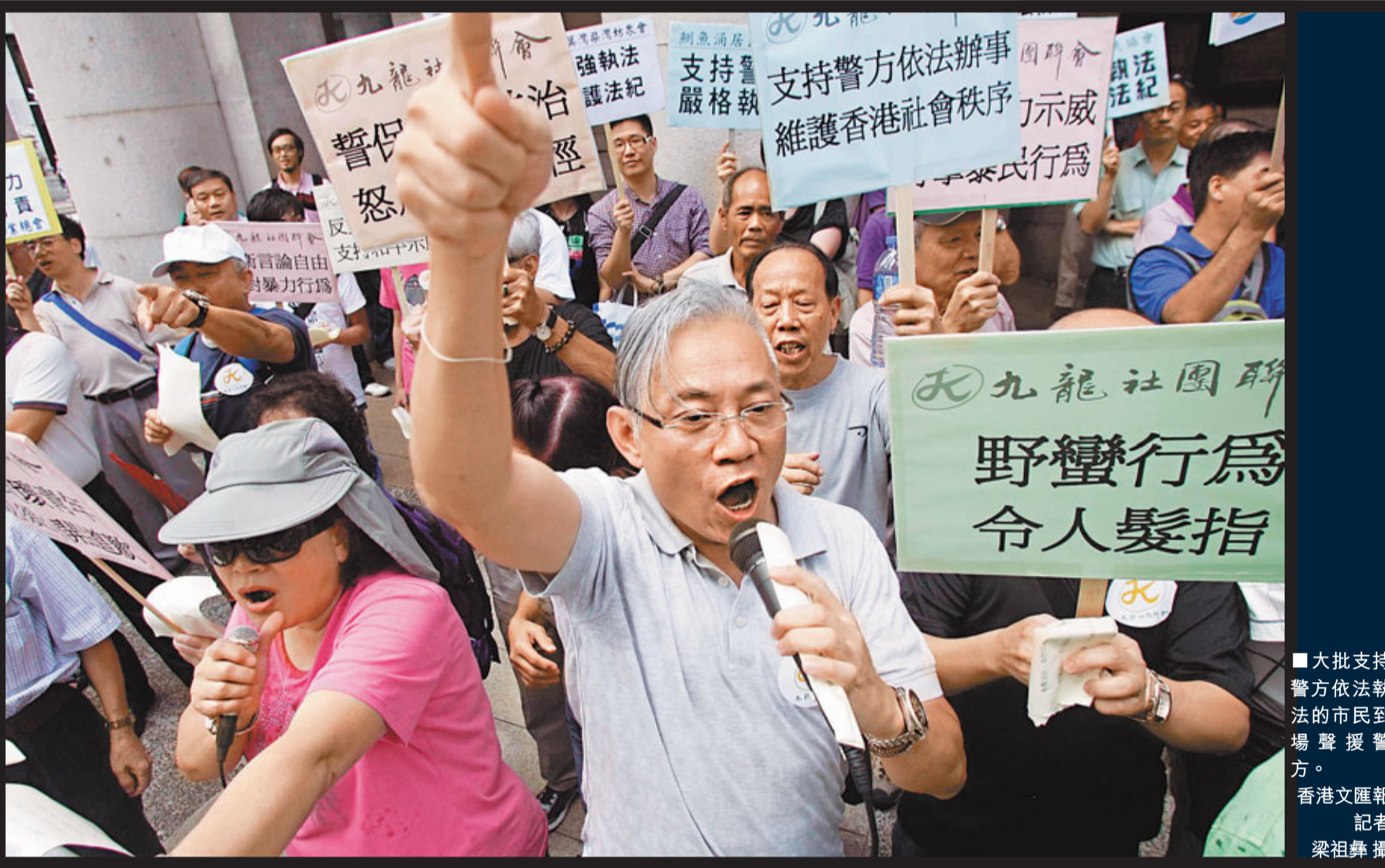
大批支持警方依法執法的市民到場聲援警方。