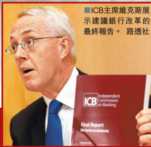
ICB主席維克斯展示建議銀行改革的最終報告。