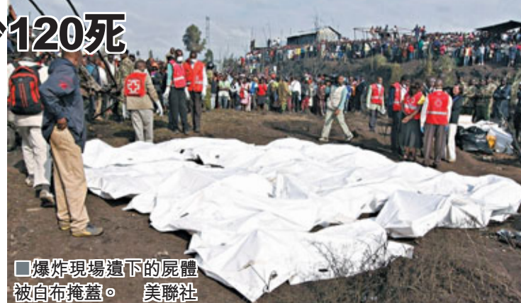
爆炸現場遺下的屍體被白布覆蓋。 美聯社

據當地官員表示，昨日較早時分，位於工業園區的一條地下輸油管道發生破裂，洩漏的原油流入附近一處貧民窟，當地民眾紛紛前往爭搶漏油。可能是因為有人在現場吸煙，不幸引發爆炸，大火造成眾多民眾傷亡。現場情況極為可怖，電視片段顯示有死者骸骨仍在燃燒，傷者面部和手臂皮膚被燒脫。 ■路透社/美聯社/法新社