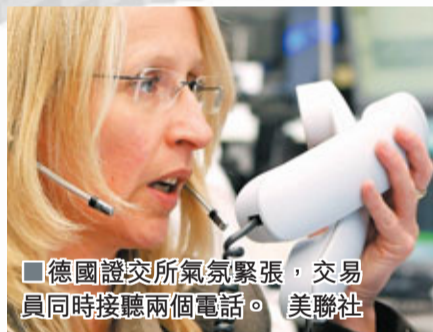
德國證券交易所氣氛緊張，交易員同時接聽兩個電話。