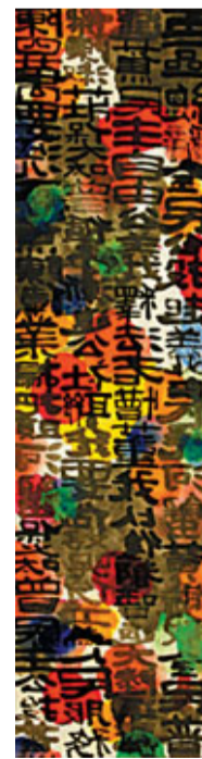
鍾承佑作品《陰謀論》