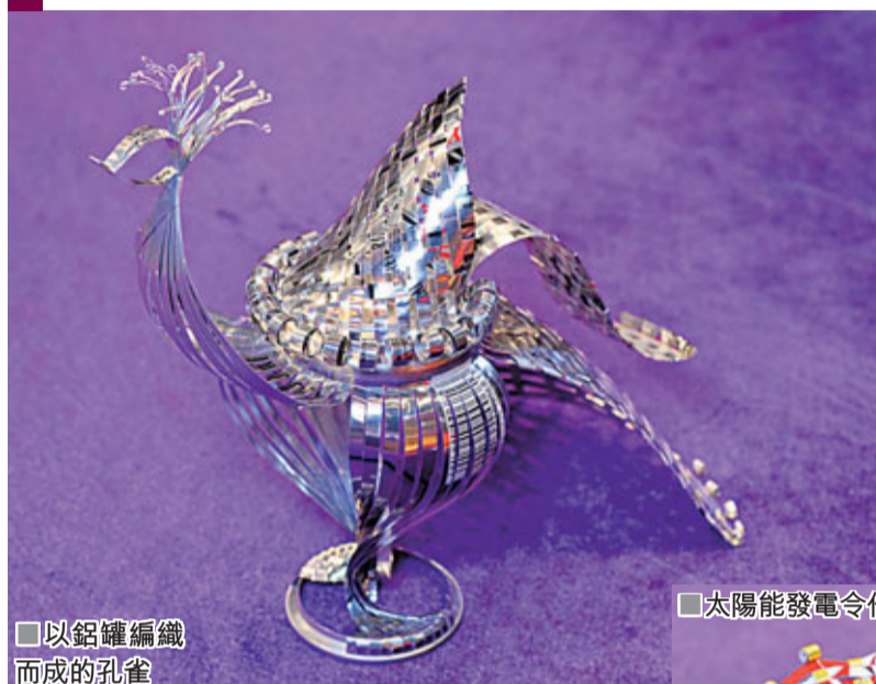
以鋁罐編織而成的孔雀