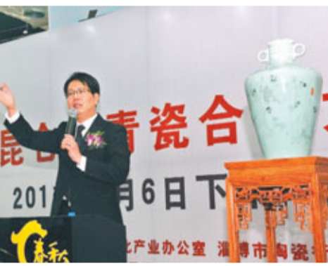
魯青瓷刻瓷作品《十八羅漢》以80萬元成交。