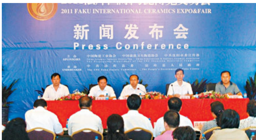
「2011法庫國際陶瓷博覽交易會」新聞發布會現場。

本屆陶博會參展的企業有來自日本、西班牙等國外的陶瓷生產、配套企業。也有來自台灣、景德鎮等地區的國內企業。陶瓷展品主要有創意陶瓷、藝術陶瓷、日用陶瓷、工業陶