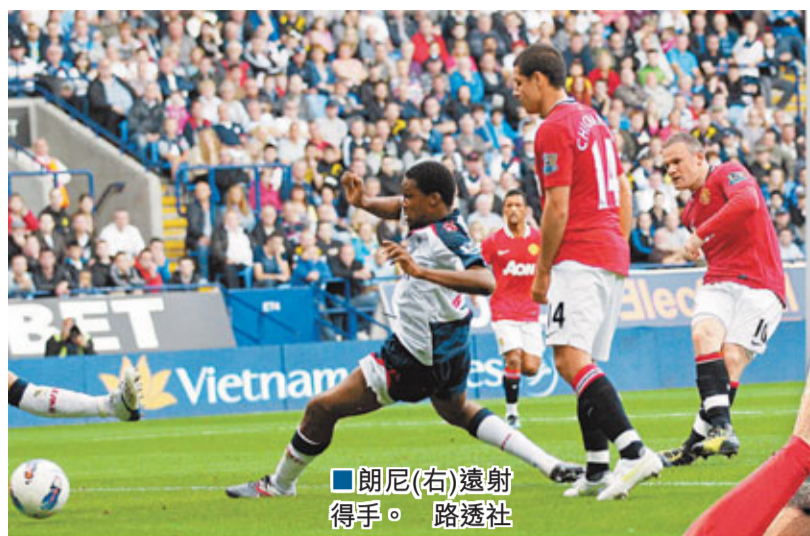
朗尼(右)邊射得手。