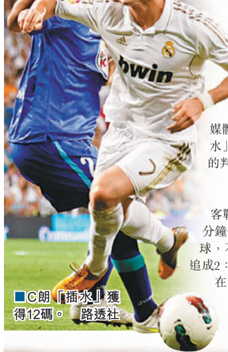
C朗「插水」獲得12碼。

香港時間周日，西甲衛冕的巴塞羅那2：2戰和皇家蘇斯達，讓皇家馬德里在戰罷兩輪便得以領先自己的老對手一個身位；「白衣軍團」主場4：2擊敗同屬馬德里地區的小球隊基達菲，暫時領跑西甲積分榜。不過賽後就有媒體指，美斯和C朗同時在關鍵時間「插水」欺騙球證，但兩人卻得到了不一樣的判罰。