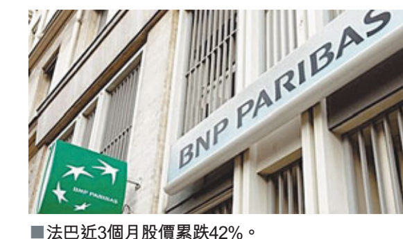
■法巴近3個月股價累跌42%。