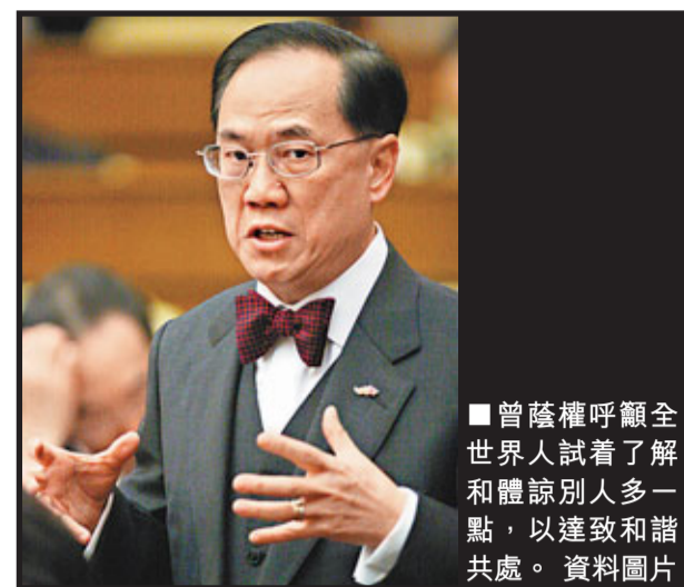
曾蔭權呼籲全世界人試着了解和體諒別人多一點，以達致和諧共處。

在網誌結尾，他特別為香港市民以至全世界人祈願，希望大家不管信念和宗教信仰如何，也試着了解和體諒別人多一點，以達致和諧共處。「如果每個人都嘗試這樣做，就是對『911』死難者和反恐犧牲者最好的致敬方式。」