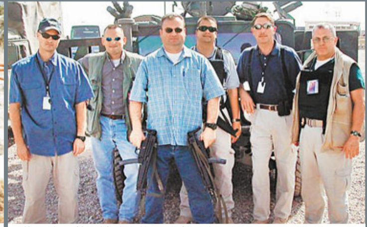
梅爾克斯蒂恩被革職後開設自己的保安公司。