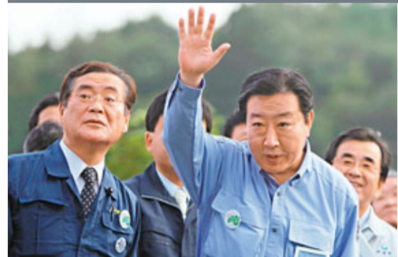
■ 野田佳彥(左)早前和野田佳彥(右)到訪災區。