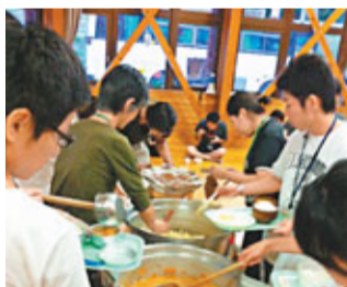
■ 經過忙碌的工作後，義工們一起食飯。