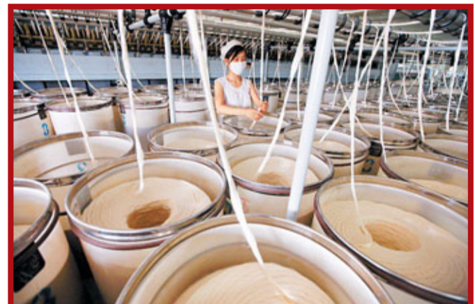
前8個月,中國紡織品出口629.6億美元,增長27.2%。

前8個月,中國與主要貿易夥伴雙邊貿易情況為,中歐雙邊貿易總值3,721.4億美元,增長21.8%。同期,中美雙邊貿易總值為2,856.5億美元,增長17.8%。與東盟雙邊貿易總值為2,346.1億美元,增長26.6%。其中,中國對東盟出口1,094.7億美元,增長24.3%;自東盟進口1,251.4億美元,增長28.6%;對東盟貿易逆差156.7億美元,擴大69.6%。前8個月,中日雙邊貿易總值為2,219.8億美元,增長18.8%。其中,中國對日本出口941.3億美元,增長25%;自日本進口1,278.5億美元,增長14.6%;對日本貿易逆差337.2億美元,減少7%。