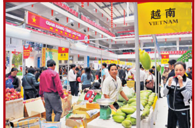
中國與東盟雙邊貿易頻繁,前8個月雙邊貿易額增長26.6%。