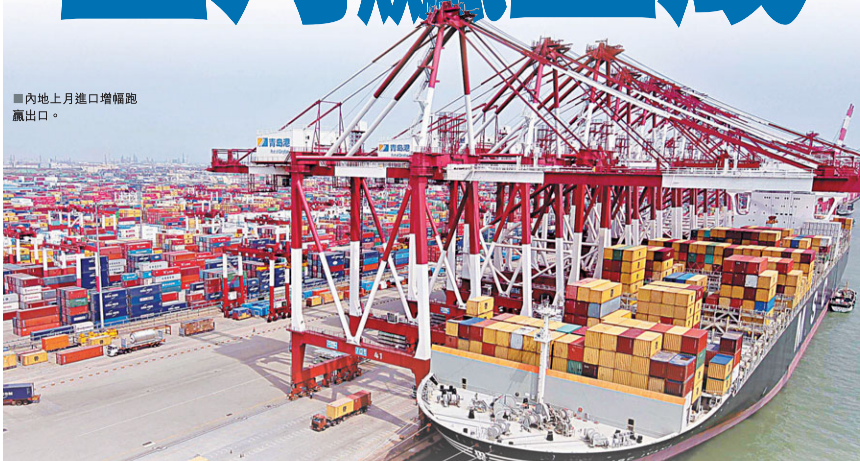
內地上月進口增幅跑贏出口。