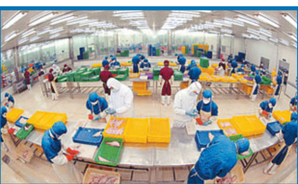
前8個月,中國對日本出口941.3億美元,增長25%。圖為山東某企業的工人正在加工對日本出口的海產品。

上述7省市進出口值合計佔全國進出口總值的82%。出口方面,前8個月,廣東省出口3,448.8億美元,增長24%。同期,江蘇省、浙江省和上海市分別出口2,041.6億、1,420.3億和1,368.4億美元,分別增長20%、22.2%和18.5%。此外,山東省、福建省和北京市分別出口822億、569.2億和373.9億美元,分別增長26.1%、24.5%和4.1%。