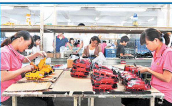
報道指,內地中小企業整體利潤率不足3%。

香港文匯報訊 據中國證券網報道,工信部運行監測協調局副局長黃利斌9日在《2011年中國工業經濟運行夏季報告》發佈會上表示,今年1至7月,中國規模以上企業運行狀況良好,但困難企業更加困難,特別是小型企業經營困難加劇,中小企業整體利潤率不到3%。