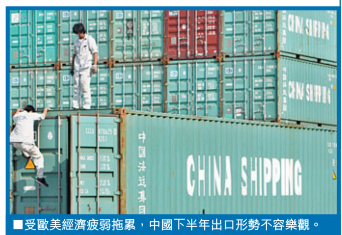
受歐美經濟疲弱拖累,中國下半年出口形勢不容樂觀。

有跡象表明,中國低價工業品出口正在經歷拐點。中國商務部數據顯示,近3個月以來,出口價格總指數已經超過出口數量指數。瑞士銀行日前發佈報告稱,過去兩年裡,中國輸往美國和歐盟的低端輕工業製造品佔當地市場的份額已在50%左右的水平見頂。