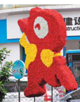
貴陽隨處可見運動會吉祥物「圓圓」。

合3大類，達到188個；出席運動員、裁判員等將達到15,000多人。二是創新較多，首次有貴州項目(獨竹漂)列入全國競賽項目，首次實行運動員註冊登記，首次對競賽項目獎勵辦法進行改革，首次設計製作異性獎牌(為牛角狀)，首次把新媒體「微博」納入宣傳工作等。三是特色較濃，不論是開幕式、閉幕式還是民族大聯歡，不論是競賽項目還是表演項目，不論是志願者服務還是運動員迎送，不論是獎牌獎盃還是氛圍營造，都具有濃郁的貴州地域特色、民族特色。