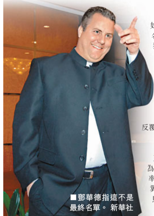
鄧華德指這不是最終名單。

8日，亞錦賽官網透露了中國男籃的初步出戰名單，如外界所料，帶傷在身的王仕鵬與周鵬雙雙被排除在名單之外；而教人意外的是段江鵬和老將張慶鵬亦未獲納入名單。中國男籃主帥教練鄧華德對此解釋，這只是初步名單，最終出戰亞錦賽人選將於14日揭曉。