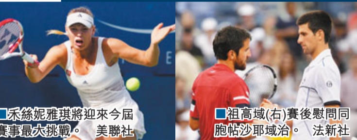
■采絲妮雅琪將迎來今屆賽事最大挑戰。

不是冤家不聚頭，男網世界第一哥祖高域與費達拿這對老對手周五在美網8強均順利晉級，連續4年將在美網4強相遇，並繼澳網和法網後，二人今年第三度在大滿貫賽4強交鋒，爭取男單決賽入場券。