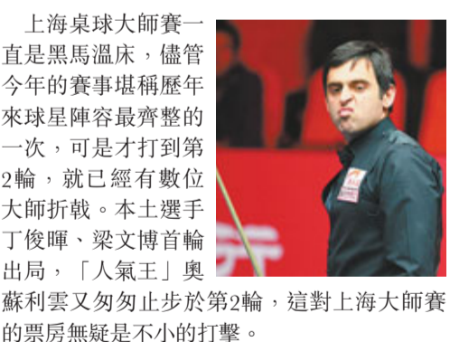
上海桌球大師賽一直是黑馬溫床，儘管今年的賽事堪稱歷年來球星陣容最齊整的一次，可是才打到第2輪，就已經有數位大師折戟。本土選手丁俊暉、梁文博首輪出局，「人氣王」奧蘇利雲又匆匆止步於第2輪，這對上海大師賽的票房無疑是不小的打擊。

香港文匯報訊 (記者 章蘿蘭 上海報道) 上海桌球大師賽頻爆冷門，繼丁俊暉首輪出局後，「火箭」奧蘇利雲(見圖)亦爆冷以3:5不敵咸美頓，無緣8強。