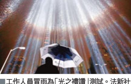
工作人員冒雨為「光之禮讚」測試。

「911」半年後，世貿遺址仍然頹垣敗瓦，紐約市民傷痛未平，這時遺址亮起兩道巨型光柱，直上天際亮遍雲霄，象徵倒塌的雙子塔，叫無數紐約人動容。這道「光之禮讚」(Tribute in Light)，將於明日再次亮起，鼓舞美國人踏出傷痛。