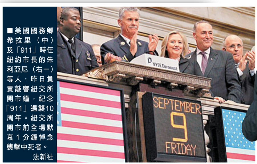
美國國務卿希拉里(中)及「911」時任紐約市長的朱利亞尼(右一)等人，昨日負責敲響紐交所開市鐘，紀念「911」週慶10周年。紐交所開市前全場默哀1分鐘悼念襲擊中死者。

美國失業率高企不下，面對支持率不斷創新低，美國總統奧巴馬前日在國會發表演說，推出總值4,470億美元(約3.48萬億港元)的一攬子就業計劃，試圖改善他在選民心中的「經濟形象」。不過市場對方案反應冷淡，加上歐洲央行有高層突然辭職加深歐債危機憂慮，道指昨日中段大瀉逾300點，歐洲股市全線低收。