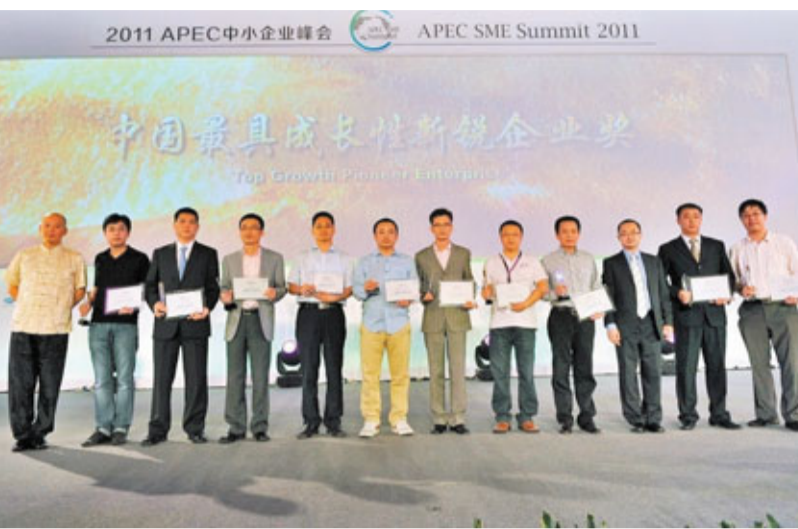
獲獎代表在頒獎典禮上合影。

香港文匯報訊(記者 江雨馨 成都報導)「2011渣打銀行·中國成長企業價值榜頒獎典禮」日前在2011亞太經合組織(APEC)中小企業峰會期間舉行。本屆「中國成長企業價值榜」由APEC中小企業峰會組委會和渣打銀行共同發起,旨在繼續鼓勵和表彰高成长性中小企業,發現價值,樹立典範,持續推動中小企業的健康發展。「年度最具成長標杆企業獎」、「中國最具成长性新銳企業獎」、「年度特別獎:服務中小企業卓越貢獻獎」等獎項,經過各機構積極的推選,近30個行業的60家優質成長企業最終入圍。