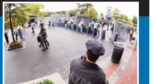
警察在球場入口駐守，加強保安。

9月11日，美國會有大量十周年紀念活動。美網決賽賽場會塗上「9-11-01」字樣；公園棒球場的草坪上會寫上「我們不會忘記」。 ■香港文匯報記者 梁啟剛