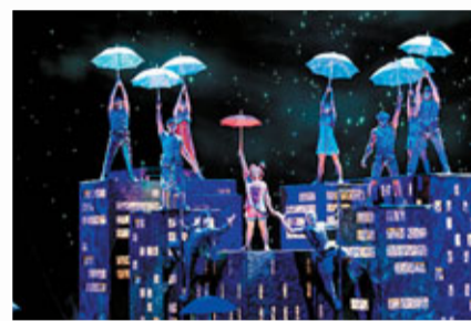
■ZAIA 帶領您感受人性的美麗

ZAIA 是美國拉斯維加斯享負盛名的太陽劇團(Cirque du Soleil)首個長駐亞洲劇團，劇中以75名來自世界各地的優秀表演者共同製作90分鐘的全新劇碼，令觀眾讚歎不已！ZAIA 講述少女踏上奇異的太空之旅，在浩瀚的宇宙中重新認識自己。少女在旅途中發現人性種種可愛之處，並把這種體會帶回地球，與人分享。