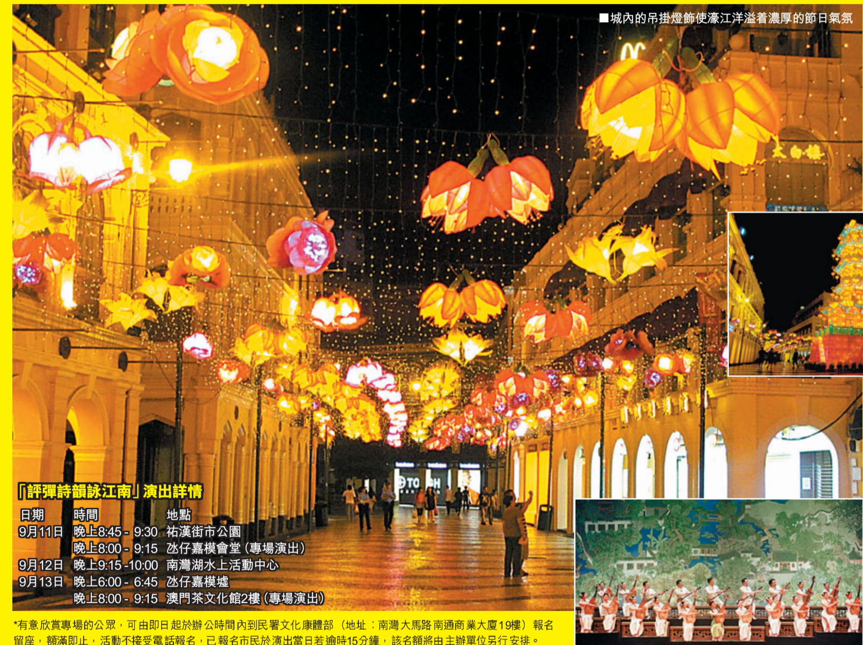
■城內的吊掛燈飾使濠江洋溢著濃厚的節日氣氛

除有花燈供市民欣賞外，還有一系列精彩的慶祝活動及表演。當中最值得關注的表演項目是首次於澳門演出的「評彈詩韻詠江南」，特別邀請了來自南京的「江蘇省演藝集團評彈團」連續3晚分別在澳門多個地點演出。除為各位帶來3場戶外的蘇州評彈表演外，更特別設有2場專場演出，讓觀眾深入感受這極具地方色彩的江南曲藝。蘇州評彈被譽為「江南奇絕」，原是盛行於江南一帶的地方曲藝，已有逾400年的歷史，2006年更被中國國務院公佈為「第一批國家級非物質文化遺產」。是次「評彈詩韻詠江南」演出將以「詩韻」為主題，以「評彈音韻」為表現形式，選取唐宋詩詞中有關描寫江南水鄉、風土人情的詩詞素材，把中國歷史悠久的評彈藝術及唐詩宋詞相結合，以精巧結構及簡潔手法生動展示出畫中神韻，讓觀眾在欣賞優美音韻及詩韻之時，也能感受中國深厚悠久的文化傳統。