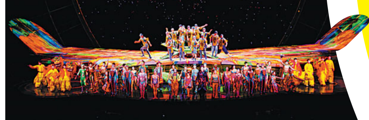
■ZAIA 是美國拉斯維加斯享負盛名的太陽劇團(Cirque du Soleil)首個長駐澳門的劇碼