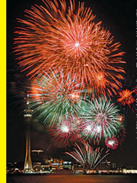
■絢麗璀璨的煙花吸引各地旅客前來觀賞

中秋節正日(9月12日)當晚，在南灣湖水上活動中心亦會舉行「飄水荷花燈活動」，屆時各位將可在免費派發的精美荷花燈上寫上祝福語句，讓心願隨水漂送。而於中秋節翌日(9月13日)晚上，亦首次在逸仔大潭山郊野公園舉行「追月觀星夜」活動。主辦單位在現場設有觀星望遠鏡，讓參加者透過望遠鏡在中秋佳節欣賞美麗的月亮及漫天繁星；為使活動更有意義，還特別安排了導賞員於現場講解天文知識。其他精彩節目還包括名曲演唱、茶座賞月、猜燈謎及圍棋等，以多采多姿的豐富節目打造出「一個繽紛慶典，與眾同樂度中秋」。