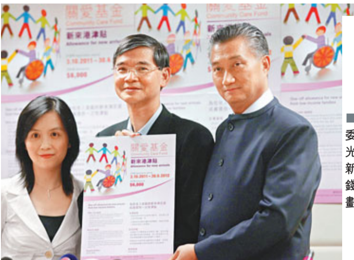
關愛基金執委會主席羅致光(中)昨公布新來港人士派錢6,000元計劃的詳情。