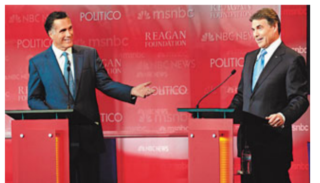
■羅姆尼(左)和佩里爭當共和黨總統候選人。

美國共和黨總統初選候選人前日舉行新一輪電視辯論，焦點落於初試啼聲的熱門參選人得州州長佩里身上，當天佩里和競敵前麻省州長羅姆尼唇槍舌劍，除了一如以往繼續攻擊總統奧巴馬，更把矛頭直指對方，圍繞創造就業的議題針鋒相對。