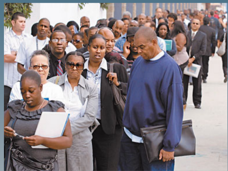
■「褐皮書」指出，美國就業市場稍有改善，但僱主招聘意願非常謹慎。圖為民眾參加招聘會。