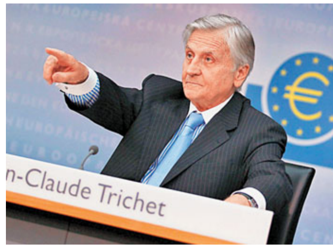
■特里謝稱，歐央行準備向區內銀行提供流動性。