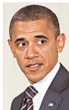
美國總統奧巴馬（見圖）本港時間今早7時於國會公布振興就業方案，民主黨消息透露，方案投入金額將加碼至逾4,000億美元（約3.1萬億港元），共和黨批評此舉猶如「二次刺激措施」，違反減赤承諾。與此同時，國會「減赤超級委員會」昨日起就削減最少1.2萬億美元（約9.4萬億港元）赤字展開磋商，但兩黨對可行措施有明顯分歧。

要達標並不樂觀。白宮發言人卡尼透露，方案會包含「合理、務實及有效」的措施，相信能促成兩黨表誠合作，為經濟及就業帶來直接迅速的影響。他多次強調華府會全數負責新增減赤措施的開支。