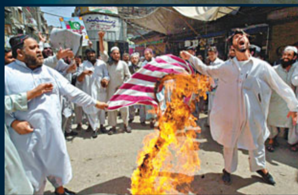
美國去年發生牧師褻瀆《可蘭經》事件，觸怒伊斯蘭世界。圖為巴基斯坦的穆斯林燒美國國旗表達憤怒。