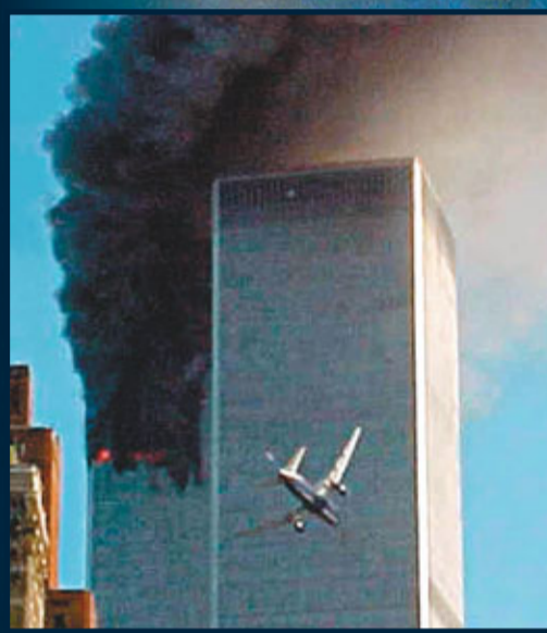
「911」恐襲當日，第三架客機撞進世貿中心後爆炸起火(右圖)。