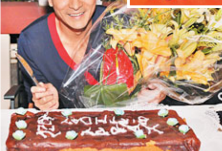
劉德華獲預祝生日，自然高興。