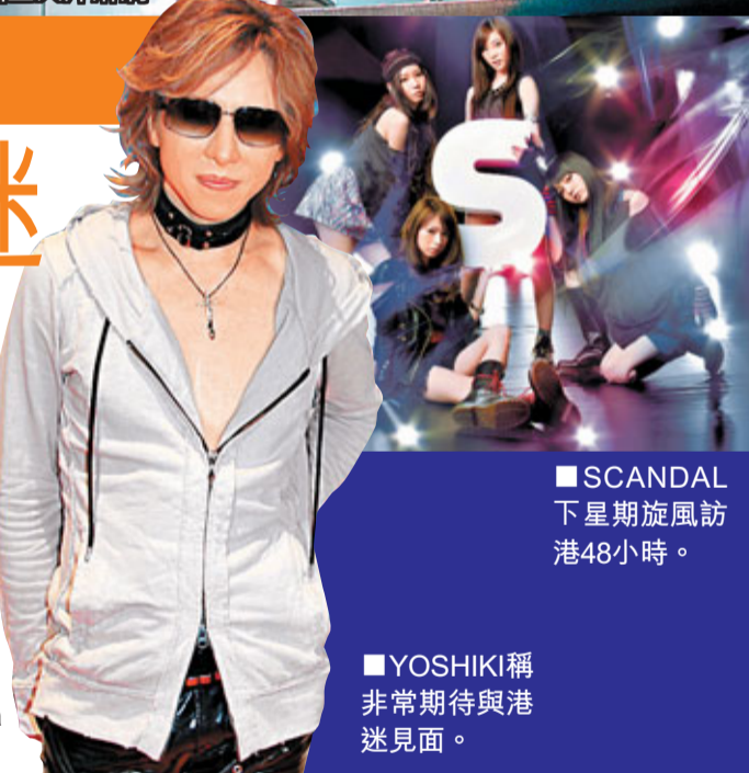
SCANDAL下星期旋風訪港48小時。