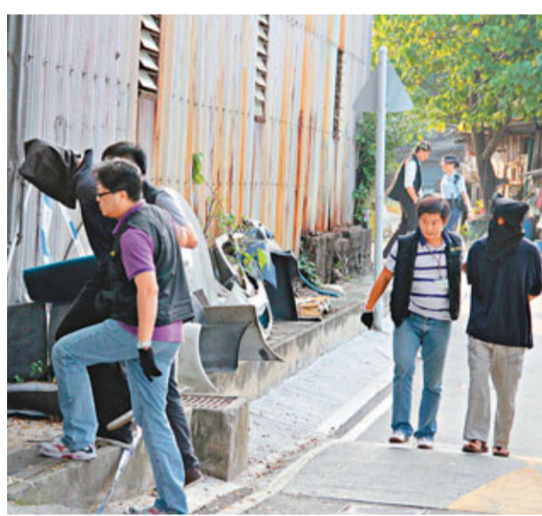
「O記」將標車參疑犯押返新元朗村藏失車贓調查。

香港文匯報訊 (記者 鄭福強、杜法祖) 被視為「辣車」之一、深受年輕靚車族歡迎的本田「型格」(HONDA INTEGRA)跑車，因新車及二手市場均十分活躍，成為偷車集團的熱門目標。警方有組織罪案及三合會調查科(俗稱「O記」)根據情報，前日在元朗破獲一個專偷「型格」跑車再勒索車主贖車的「標車參」集團，當場起回3輛「型格」跑車，拘捕3名有黑社會背景男子，警方相信該集團若勒索車主不遂，會將車改裝「借屍還魂」脫手謀利。