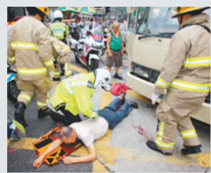
救護員檢視被救出老翁傷勢。

社民連成員黃俊傑及黃浩銘今年3月，趁行政長官曾蔭權到科學館出席辛亥革命展覽，其中一人持一盒粟米斑塊飯，走近曾蔭權示威時引起混亂，期間曾蔭權報稱被撞胸口，感到痛楚，曾經到瑪麗醫院驗傷。2名被告其後被控擾亂公眾秩序，上週五於九龍城裁判法院，被裁定罪名不成立，當庭釋放。