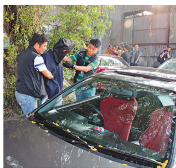
探員將疑犯押返起回3部「型格」失車現場調查。