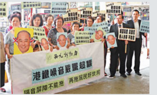
■西九新動力聯同多名區議員，以及居民代表，要求港鐵解決噪音問題。

在三藩市期間，鄭汝樺會與Transbay Joint Project Authority及三藩市交通局會面，就已發展城市內進行大型運輸基建工程的事宜交換意見，並會參觀市內其中一個重建項目。