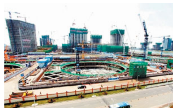
已具雛形的亞洲最大樓宇地下空間

香港文匯報訊 據《濱海時報》報道，記者日前在天津濱海新區于家堡金融區施工現場看到，亞洲最大樓宇地下空間已具雛形，這些空間將建成多功能立體式的交通網絡。基坑深度為30米，建築面積達10萬平方米，將被分為5層，除了用於建設停車場、公交站、地鐵外，還將建立一批超市、醫療診所、餐飲服務、購物街、電影院、銀行等多功能服務區域。