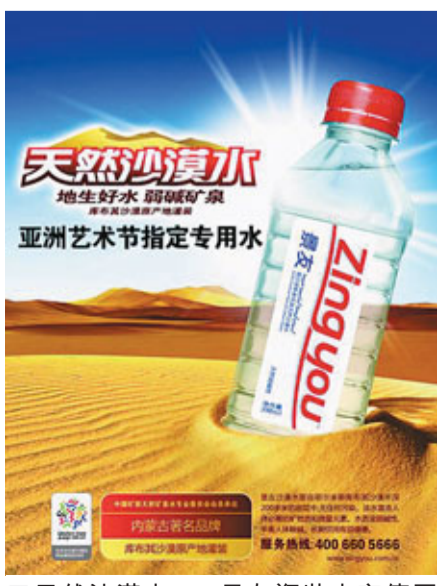
天然沙漠水——景友瓶裝水宣傳圖片

中國在2009年10月開始把溴酸鹽列入飲用水監測項目，規定溴酸鹽含量最高不超過0.01mg/L。然而，「新國標」實施兩年多來，並沒有管住溴酸鹽超標問題。