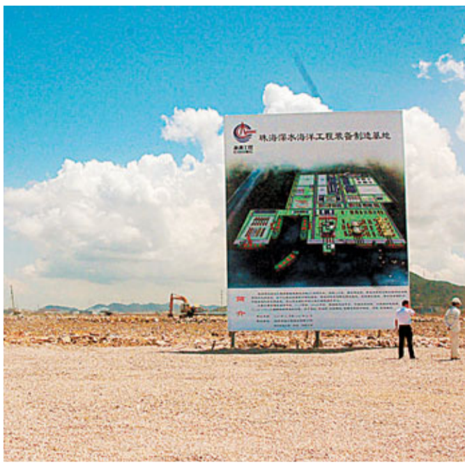
中海油珠海深水海洋工程裝備製造基地目前正在建設中,計劃2015年建好。

目前,中海油已經在南海東部海域的荔灣3-1和流花34-2獲得了重大深水天然氣發現。據透露,荔灣3-1氣田首期探明儲量為1,500億立方米,初步計劃2013年上岸,主要供應廣東省,而根據具體情況也可能輸送到香港。