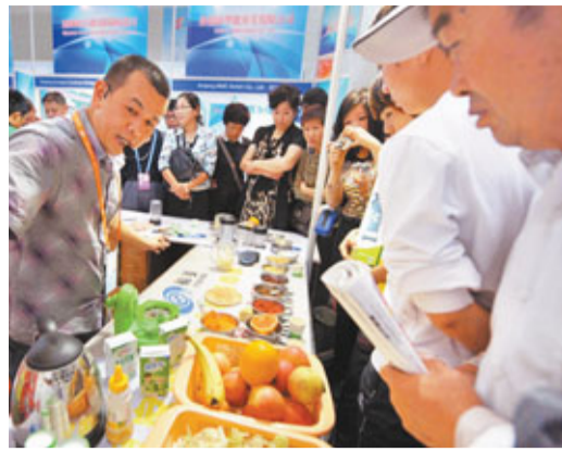
亞博會一位參展商(左)向參觀者介紹企業產品。

香港文匯報訊(記者 應江洪、賀臻、李小平 烏魯木齊報導)為期5天的首屆中國—亞歐博覽會日前閉幕。亞博會經貿合作取得豐碩成果,累計實現對外經濟貿易成交總額55.06億美元,內聯合作項目和國內貿易合同簽約總額7930.26億元。展會參觀者有31萬人,國內外客商5萬多人。