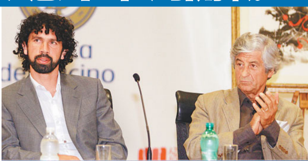
意大利足球員工會主席湯馬斯(左)在會上發言。

在這份臨時協議中，雙方依然存在兩點分歧。第一點涉及「團結稅」(意大利政府對高收入人群的稅收)由誰支付，目前的協議規定球員自己支付，但球員顯然希望球會為他們分擔這筆稅款。第二點涉及球會對球員的方式，球員工會要求有合同在身的球員，就算不在球隊計劃之內，球隊也不准拒絕其參加全隊合練。