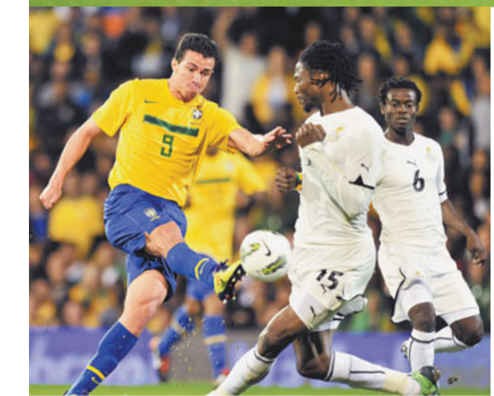
達美奧(左)數度威脅對方大門。