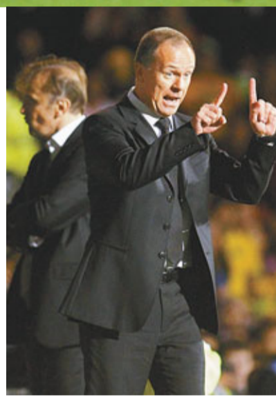
文帥滿意球隊表現。

這是細哨9個月以來首次入選巴西國家隊，也是他自去年世界盃被排除出國家隊後第二次入選。從歐洲聯賽回到巴西法林明高後，細哨的狀態明顯回升，目前在巴甲聯賽中已有12球進帳，名列射手榜第2位。