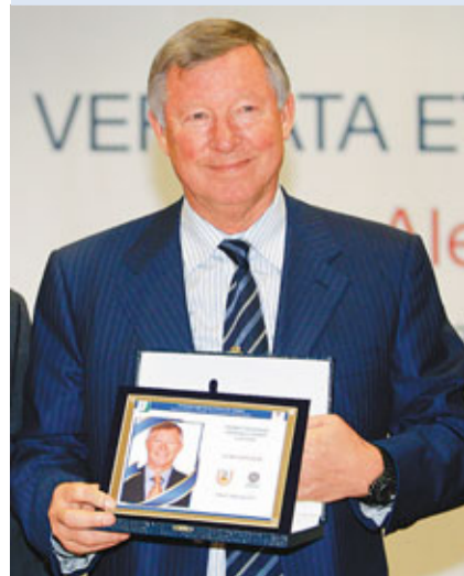
費爵爺再添榮銜。

英超曼聯領隊費格遜日前在羅馬Tor Vergata大學獲頒予2011年體育道德模範獎，這也是該獎項頒發的第10個年頭，索夫和柏天尼等足壇名宿也曾獲此殊榮。據報道指，該獎授予費格遜這位主帥，旨在引導青少年尊重公平競技和誠信，以及注重球場內外的表現。曼聯上屆歐聯決賽不敵巴塞羅那，但費爵爺還是表現出落敗者應有的風度。