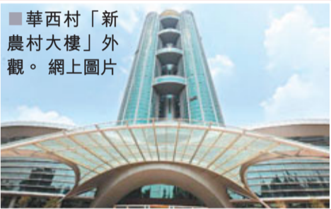
華西村「新農村大樓」外觀。網上圖片