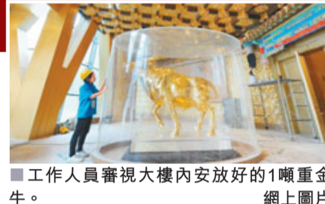
工作人員審視大樓內安放好的1噸重金牛。

被譽為「中國首富村」、「天下第一村」、位於江蘇省陰陵市的華西村自改革開放以來，在蘇南農村迅速崛起，這個最初面積只有0.96平方公里、人均收入只有53元的村寨，實現了「家家住別墅，戶戶有汽車」的神話。最近，華西村再上一層樓，投資15億興建的「空中新農村大樓」即將裝修完工，1噸重的金牛(價值達3億元)已安裝到位，預計下月建村50周年之際投入使用，勢成當地新地標。