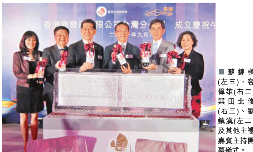
Innovation 廚魔」的名廚即場示範菜式。「香港美酒佳餚月」由今年10月27日至11月30日舉行,率先揭開活動序幕的是「香港美酒佳餚巡禮」,於10月27日至30日在西九龍海濱長廊舉行,屆時將有來自51個地區約220個攤位提供各種美酒佳餚。而另一重點活動「食府盛筵」,將有多間餐廳以6至7折的價錢提供美食,希望以美食美食吸引台灣旅客,本港市民亦可由下月中起向餐廳預訂。

旅發局於台灣推廣「香港美酒佳餚月」的活動亦於同日展開,為配合推廣這個旅遊盛事,旅發局特地邀請本港2家「米芝蓮」星級餐廳「添好運」和「Bo