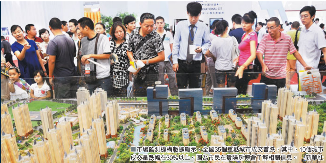
市場監測機構數據顯示,全國35個重點城市成交普跌,其中,10個城市成交量跌幅在30%以上。圖為市民在貴陽房博會了解相關信息。

香港文匯報訊(記者 劉坤領 北京報導)9月,樓市進入了傳統的銷售旺季「金九銀十」。然而,不論從供應還是銷售來看,內地樓市上週的表現都不盡如人意,「金九」似乎成色不足。市場監測機構數據顯示,全國35個重點城市成交普跌,其中,10個城市成交量跌幅在30%以上。分析人士指出,目前樓價仍處高位運行,購房者觀望情緒較為濃厚,大多在等待樓價進一步下降。