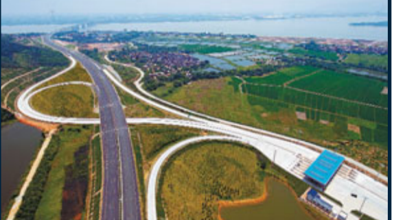
廣州、佛山、肇慶經濟圈10年規劃敲定。圖為連接廣州和佛山的廣明高速公路。 資料圖片

《規劃》強調以廣州中心城區為核心,以佛山中心城區和肇慶中心城區為副中心,形成「一主兩副」的空間增長與組織中心。