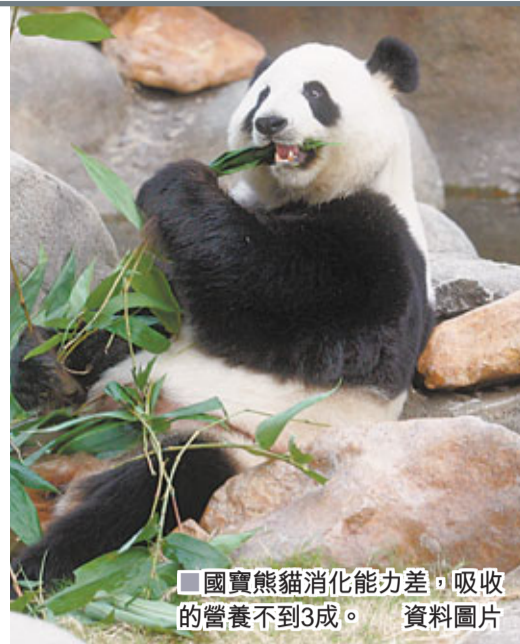
國寶熊貓消化能力差，吸收的營養不到三成。