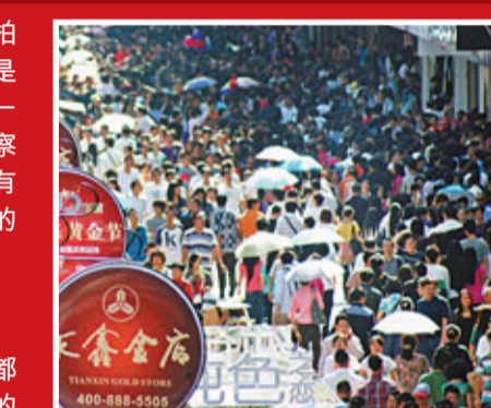
成都人口眾多，重名在所難免。