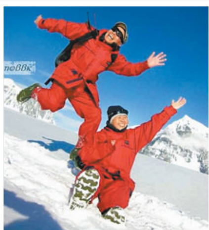
老夫婦在南極作出搞怪合影。