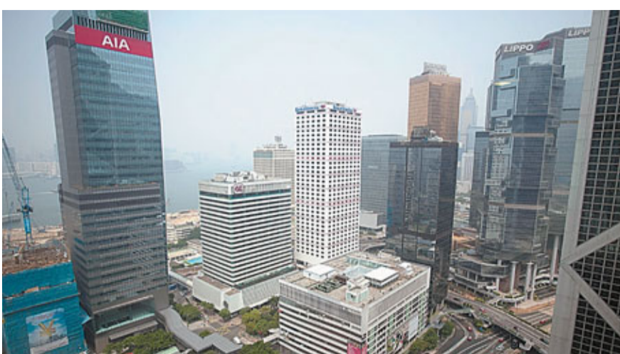
本地投資者佔香港對沖基金轄下管理資產總數不足一成。

據了解，高橋資本管理號稱是全球最大的對沖基金，Huttenlocher原為該基金亞洲業務負責人，但在金融海嘯期間已離職。早前他宣布將在本港推出對沖基金Myriad，料將擁有約3億美元初始資金，並隨後將向外部投資者開放，預計