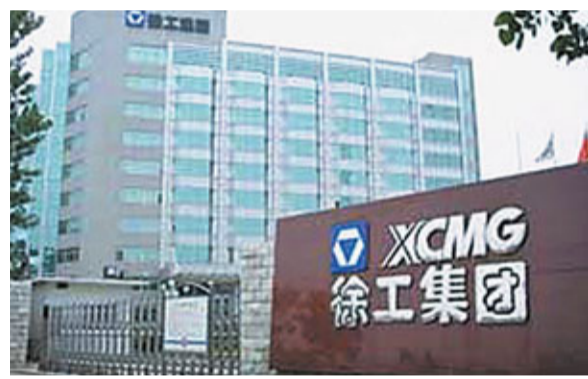
三一重工競爭對手徐工機械計劃發行5.93億H股，集資約156億元。