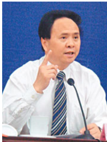
四川省委宣傳部常務副部長侯雄飛。

香港文匯報訊(記者 江雨馨 成都報導)理縣當局近日在成都向全球賓客發出邀請「到理縣看寨子」,品味獨具魅力的藏羌文化,感受理縣災後重建的巨大變化。