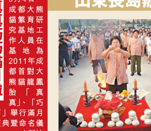
山東長島辦千人海鮮宴。圖為開席前祭祀活動。