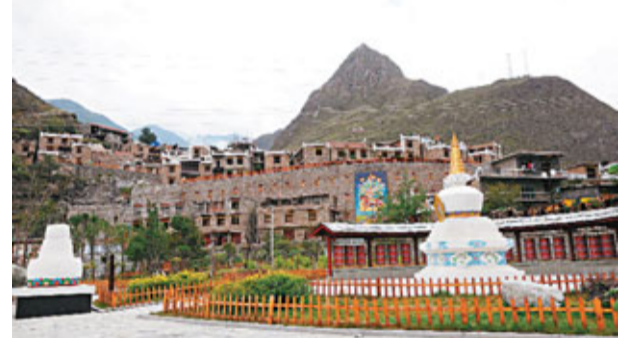
嘉絨藏區第一寨甘堡藏寨。

理縣人民依托得天獨厚的自然、人文、歷史資源優勢,和317國道的區位優勢,在全境126公里的藏羌文化走廊上,建成了獨具瑪瑪神韻的東方神秘古堡——桃坪羌寨、歷史文化古鎮——薛城古鎮、博巴森根故鄉——甘堡藏寨、嘉絨風情村落——古爾溝丘地村等一大批旅遊村寨,並規劃了5條精品旅遊線路,形成了獨具理縣特色的鄉村旅遊帶和集休閒、養生、觀光、度假的四季旅遊格局。為災後的理縣經濟發展,開拓出綠色環保的新路。