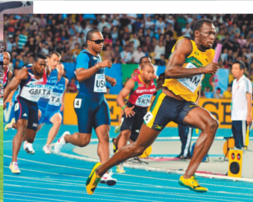
保持接棒後瘋狂加速。