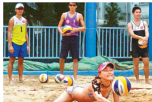
港沙排隊員在新場地訓練。

香港文匯報訊（記者潘志南）政府動用600萬元興建的首個沙灘排球和手球二用場地，為推動以上兩項運動帶來推動力。建於葵芳葵涌運動場的沙、排球和手球場地符合國際標準，交通方便，今年3月啟用以來已成為香港沙排隊主要訓練場地。