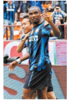
伊度奧被國米「賣掉」。

國米顯然並沒有注意到科蘭沒有資格參加小組賽的比賽，而根據轉會市場的慣例，如果一名球員新賽季無資格參加歐聯，那麼身價必定會有所下降，雖然科蘭身價不高，但在財政困難的情況下，國米顯然希望能省則省。另一方面，歐足聯在處理此事時也存在問題，因為既然科蘭沒有資格報名，那麼歐足聯為何不在國米遞交名單之時就向國米明確表示科蘭無法報名，而要等到2天之後才宣佈科蘭無資格？最終的結果致使國米已經無法更換球員。