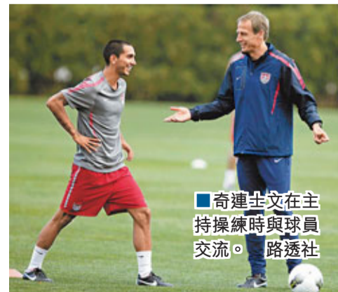
奇連士文在主持操練時與球員交流。

自7月29日上任以來，美國隊新任主帥奇連士文還在苦苦追尋他接手球隊後的首場勝利，對於下周中和比利時隊的友誼賽，他表示球員需要更有決心，踢得更堅強一點兒。奇連士文這次執教美國隊可謂是開局不利，首場戰平老對手墨西哥勉強及格，可9月2日與哥斯達黎加隊的比賽以0:1告負就有些說不過去了。結果固然尷尬，但奇連士文從失利中也發現了球隊目前存在的問題。