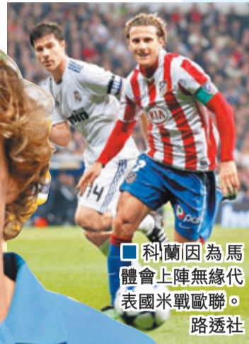
科蘭因為馬體會上陣無緣代表國米戰歐聯。