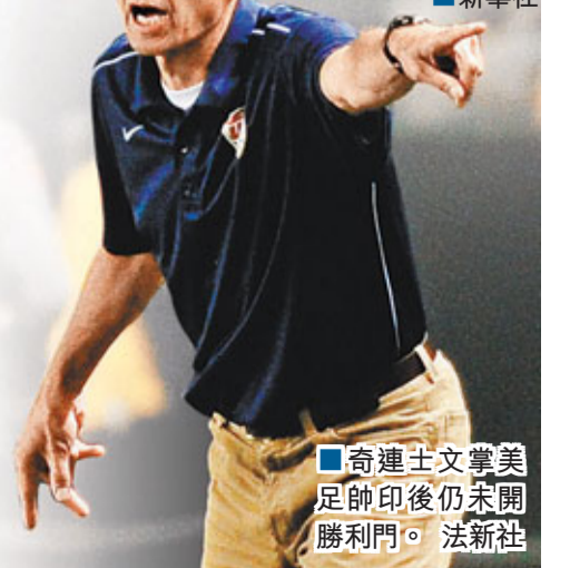
奇連士文掌美足帥印後仍未開勝利門。

美國隊對奇連士文的新戰術理念還有些陌生，對此老將多諾萬最有發言權：「我們訓練時花了大量的時間去體會教練的意圖，隨情況會越來越好的。」