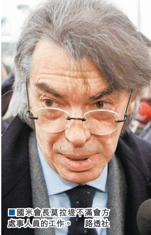
國米會長莫拉提不滿會方處事人員的工作。