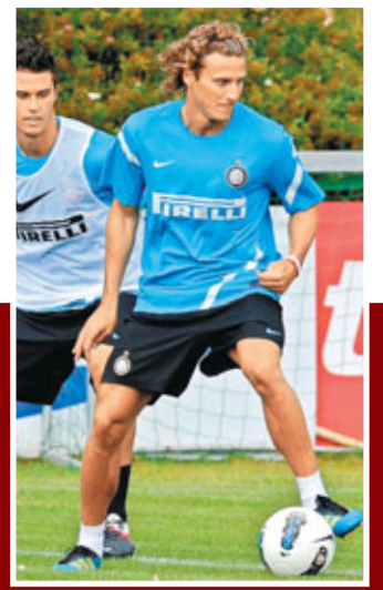
科蘭加盟國米後參加球隊訓練。