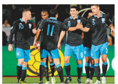
英格蘭新球衣劣評如潮。

這是英格蘭新款的客場守門員隊服，和愛華頓的門將隊服一同推出，樣品一出來，就遭到了如潮的惡評。《郵報》評論